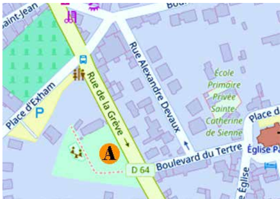
Jardin du Presbytère à Saint-Lunaire